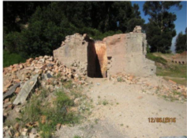
Fotografías Nos. 4 y 5. Antigua Ladrillera Los Cerezos Se aprecian los hornos tipos árabes en proceso de desmantelamiento.